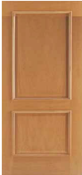
2 PANELES RECTA