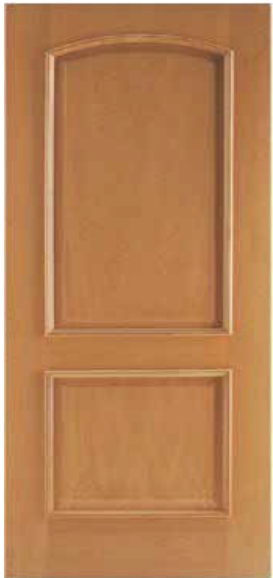
2 PANELES CURVA