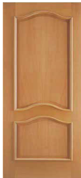
2 PANELES NAP